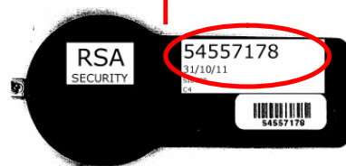
esempio di "serial number" sul retro della chiavetta